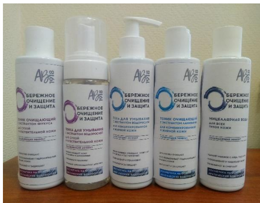
Архангельск. 2021 г